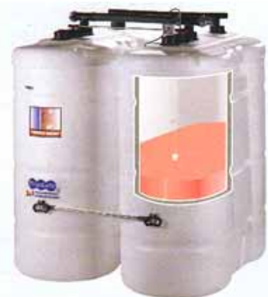
Moderne Tanks brauchen wenig Platz und lassen keinen unangenehmen Ölgeruch nach außen dringen.