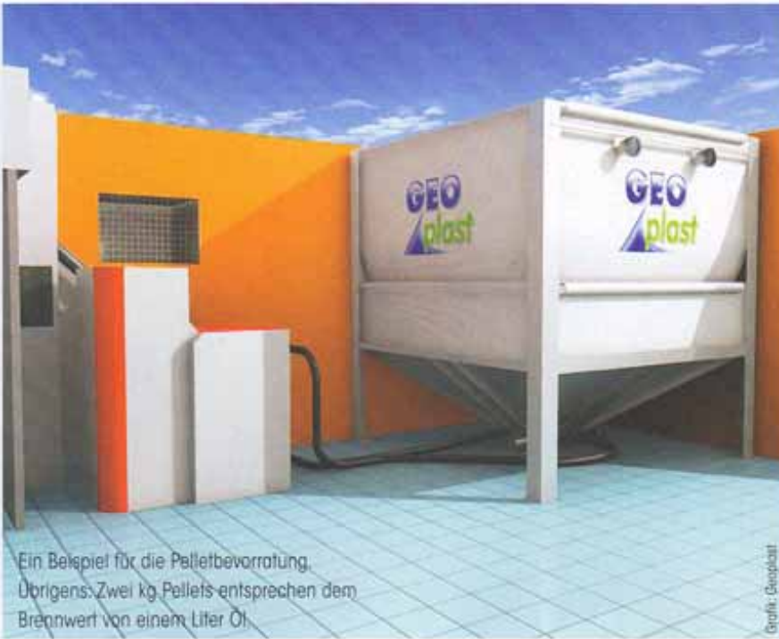
Ein Beispiel für die Pelletbevorratung. Übrigens: Zwei kg Pellets entsprechen dem Brennwert von einem Liter Öl.